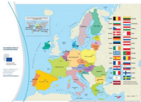
Figura nr.1 Statele membre ale Uniunii Europene (2020)

astfel încât deciziile cu privire la chestiuni specifice de interes comun să poată fi luate în mod democratic la nivelul UE.